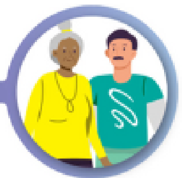
Tdap or Td